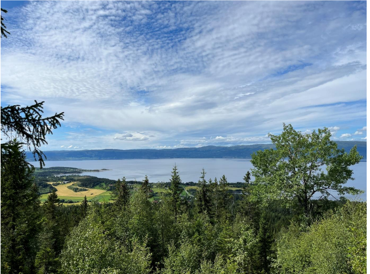
Bilde 1: Utsikt fra toppen av Ingjalshålan.

Dette utsiktspunktet kan nås fra flere startsteder. Man kan starte ved Fossen, Lilleby eller ved Luteriet i Skjemstadaunet. Fra alle steder går det merket sti oppover. På toppen er det benker hvis man ønsker å ta en pause for å nyte utsikten.